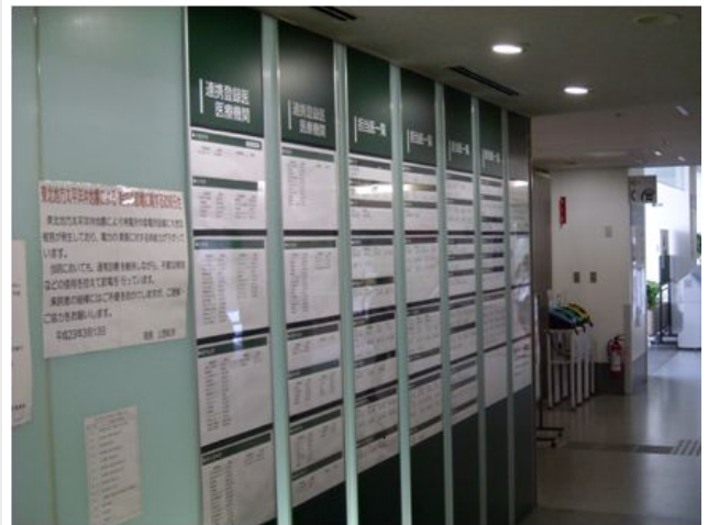
玄関付近には院内の医師と同様に、登録医の一覧も掲示しています。

登録医は諸検査や手術の見学、図書室等の院内設備の利用、開放病床の利用や共同診療などを行うことができ、当院にご紹介を頂いた入院中の患者さんの状態をより把握することが出来ます。